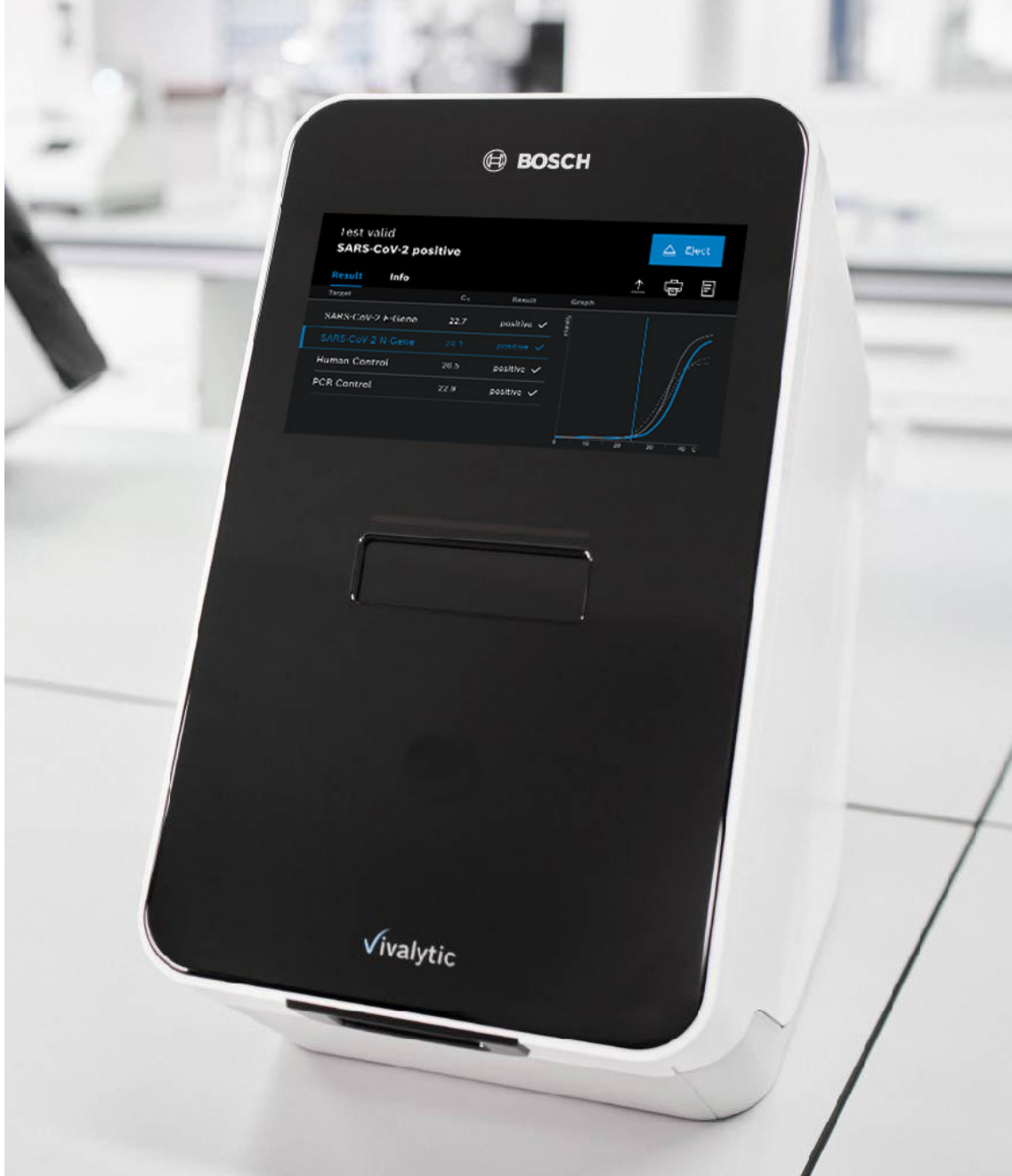
Am Vivalytic Analyser wird die Detektion der Erreger als Kurvenverlauf ausgegeben.